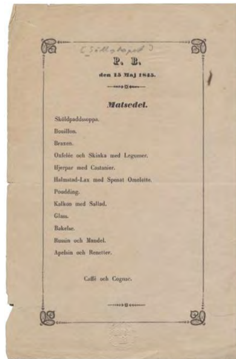
Matsedel, Sällskapet Par Bricole den 15 maj 1845