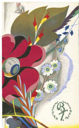
Matsedelsomslag Brända Tomten 1932