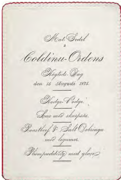
Mat-Sedel (egentligen en meny) Coldin-Ordens högtidsdag den 15 augusti 1875

studera, det är en lång huggare med hiskeliga kråkfötter, ensamt den tål sin lilla kvart att draga igenom.”