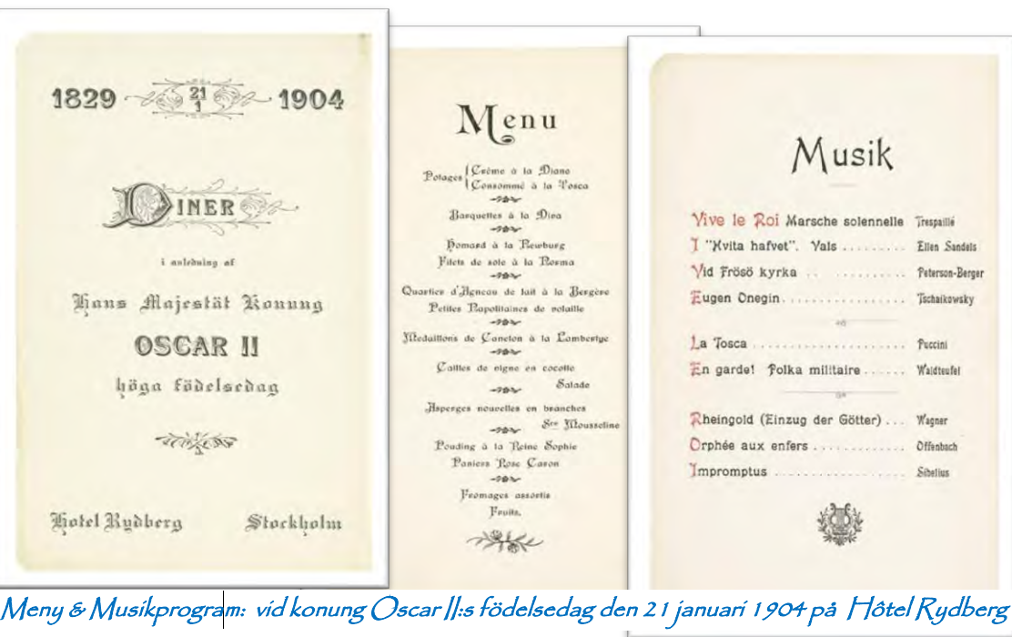
Meny & Musikprogram: vid konung Oscar II:s födelsedag den 21 januari 1904 på Hotel Rydberg