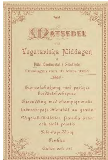
Vegetarisk middag den 16 mars 1892, Hôtel Continental, Stockholm