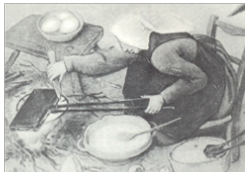
Gräddning av rån över öppen eld. Detalj ur fastlags-festen. Oljemålning av Pieter Brueghel 1525-1569.

Vid förra sekelskiftet blev det populärt att äta våfflor med grädde och sylt till kaffet. Ett måste efter söndagspromenaden då det fanns gott om våffelbruk, framförallt i Stockholm. Att man kunde tjäna bra med pengar på våfflor upptäckte jag när jag på 1970-talet drev det lilla Wårdshuset Carl Michael på Djurgården. En vinter med ”magra dagskassar” införskaffades två elektriska ”dubbel-våffeljärn” och vi serverade våfflor med tillbehör ”för fulla hus”. Förtjänsterna var goda och våffelserveringen pågick framgångsrikt vintertid under flera år.